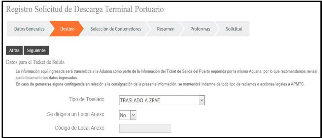
Imagen 02 Tipo "TRASLADO A ZPAE"