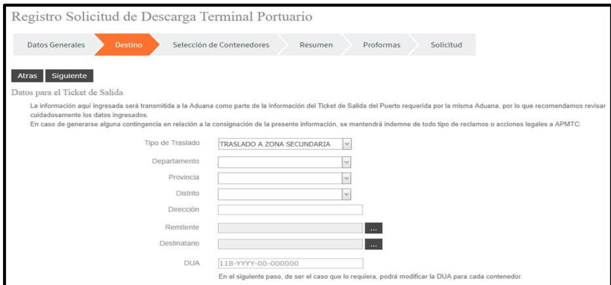
Imagen 03 Tipo "TRASLADO A ZONA SECUNDARIA"