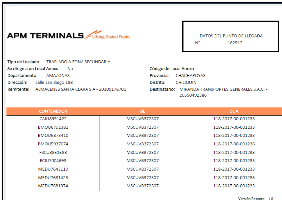
Imagen 06 Reporte de Datos registrados para el Ticket